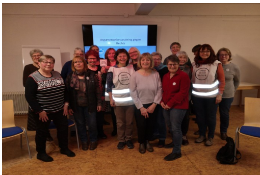
Schnupperkurs bei der Freiwilligenagentur