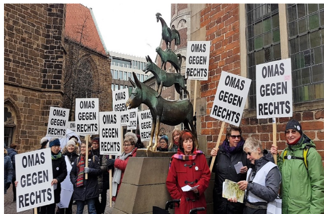
Die OMAS GEGEN RECHTS BREMEN ziehen am 7.03. 2020 singend ums Bremer Rathaus