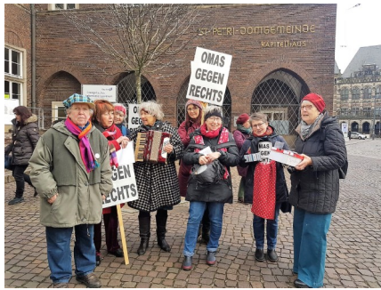
Weihnachtsaktion mit Keksen und Musik vor Kapitel 8 im Dezember 2019