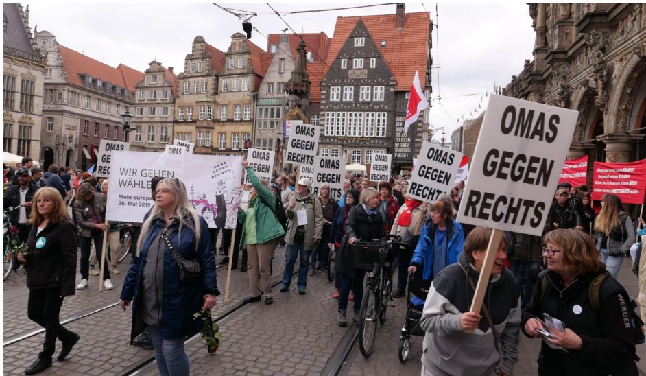
Im Mai 2019 Sternmarsch gegen Rassismus in Bremen

Bremer OMAS nehmen im August 2019 am Tag der Kinderrechte im Rhododendron-Park teil