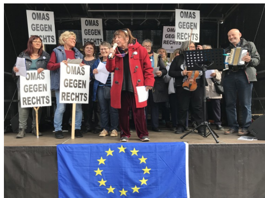
Europafest auf dem Bremer Marktplatz - die Bremer OMAS sind mit einer kurzen Rede und 3 Songs dabei.

Im März und April 2019 waren die OMAS auf vielen Märkten