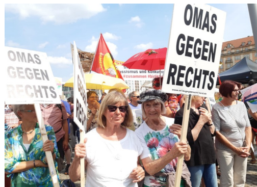
Bremer OMAS bei der Großdemo in Dresden im heißen August 2019